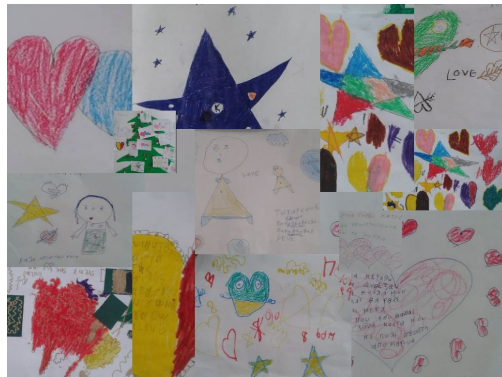
Ζωγραφιές από μαθητές και μαθήτριες του 4ου Δημοτικού Σχολείου Σοφάδων