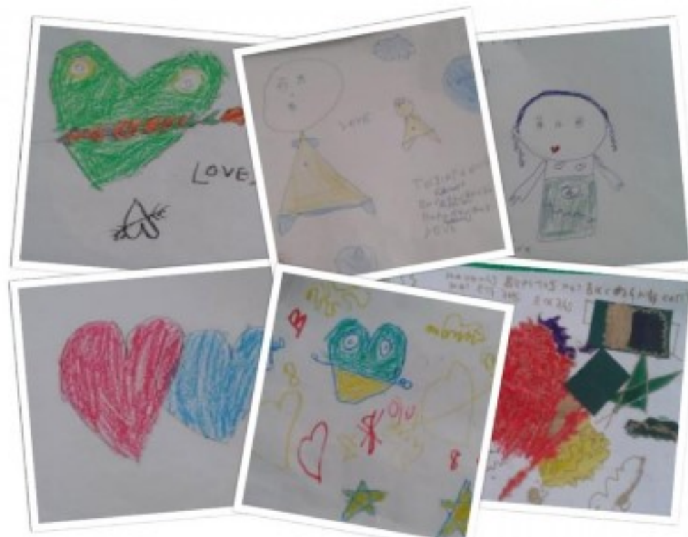
Ζωγραφιές από μαθητές και μαθήτριες του 4ου Δημοτικού Σχολείου Σοφάδων