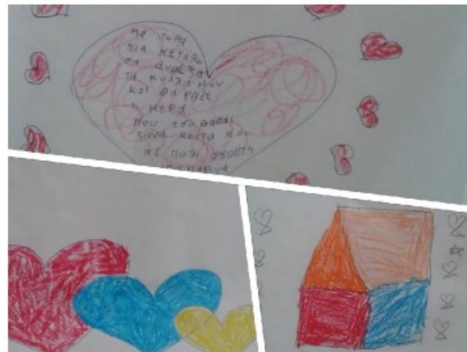
Ζωγραφιές από μαθητές και μαθήτριες του 4ου Δημοτικού Σχολείου Σοφάδων