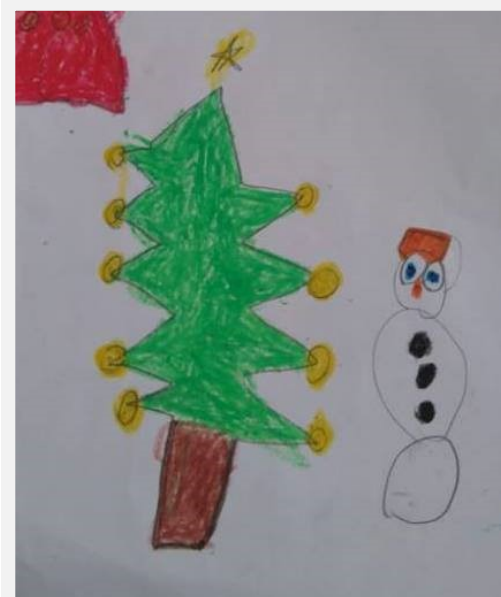
Ζωγραφιές από μαθητές και μαθήτριες του 4ου Δημοτικού Σχολείου Σοφάδων