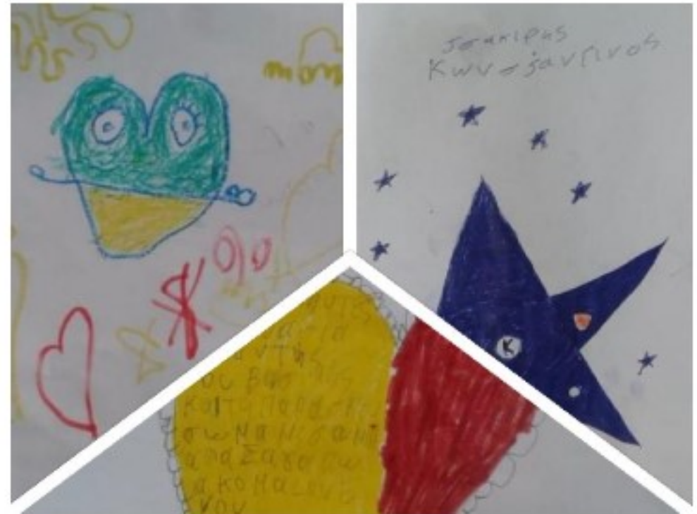
Ζωγραφιές από μαθητές και μαθήτριες του 4ου Δημοτικού Σχολείου Σοφάδων