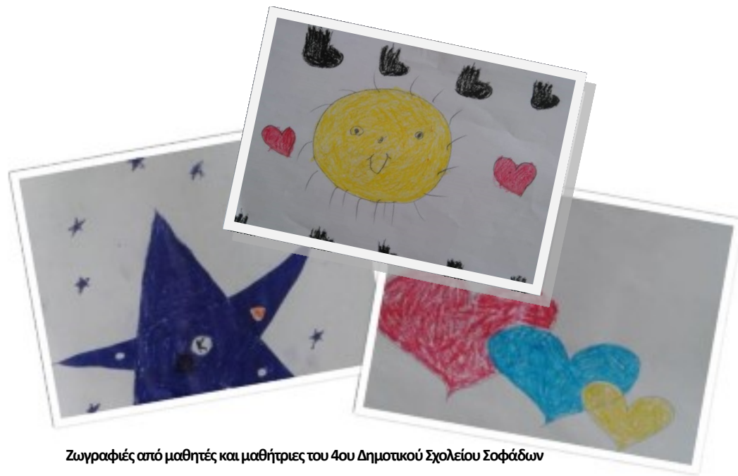
Ζωγραφιές από μαθητές και μαθήτριες του 4ου Δημοτικού Σχολείου Σοφάδων