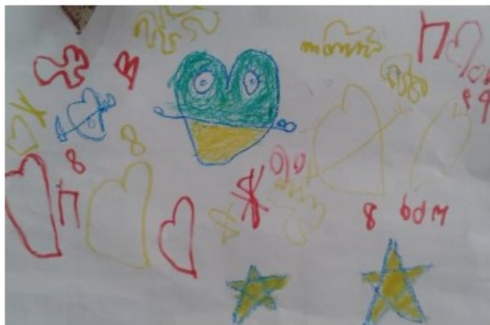
Ζωγραφιές από μαθητές και μαθήτριες του 4ου Δημοτικού Σχολείου Σοφάδων