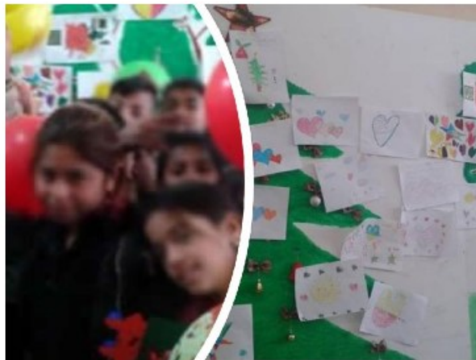
Ζωγραφιές από μαθητές και μαθήτριες του 4ου Δημοτικού Σχολείου Σοφάδων