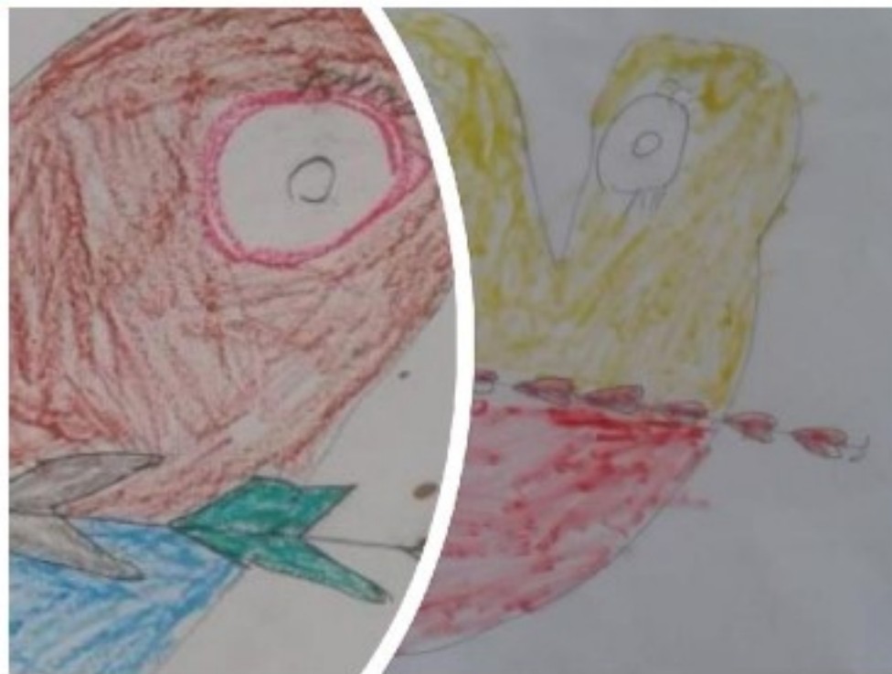
Ζωγραφιές από μαθητές και μαθήτριες του 4ου Δημοτικού Σχολείου Σοφάδων