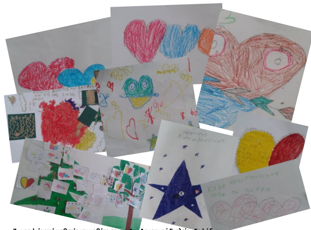
Ζωγραφιές από μαθητές και μαθήτριες του 4ου Δημοτικού Σχολείου Σοφάδων