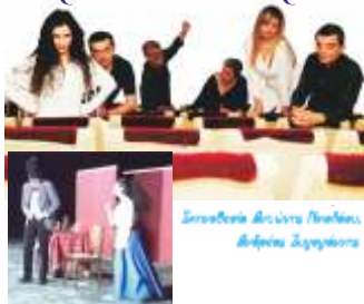
Συνθεσία: Βασίλης Βασιλικός Διεύθυνση: Βάσω Μακρή