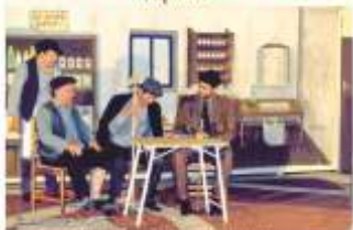
Μουσική & Τραγούδια: Χρήστος Νικολαΐδης